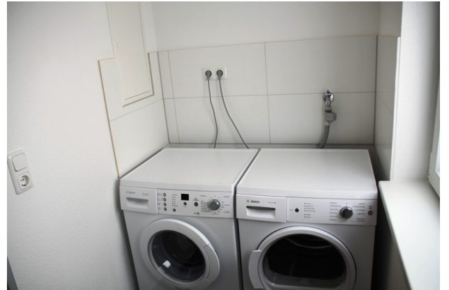
■ Waschmaschine und Trockner