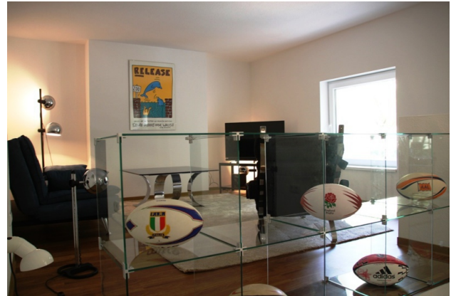
■ Blick auf das Wohnzimmer