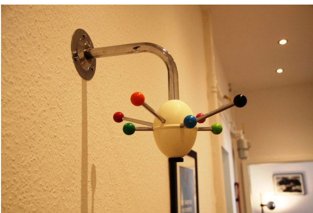
■ Liebe zum Detail