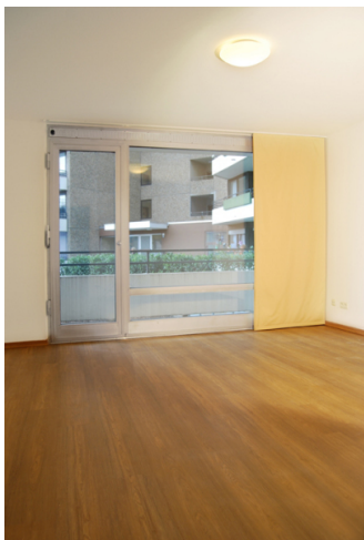
■ Wohn- und Schlafzimmer