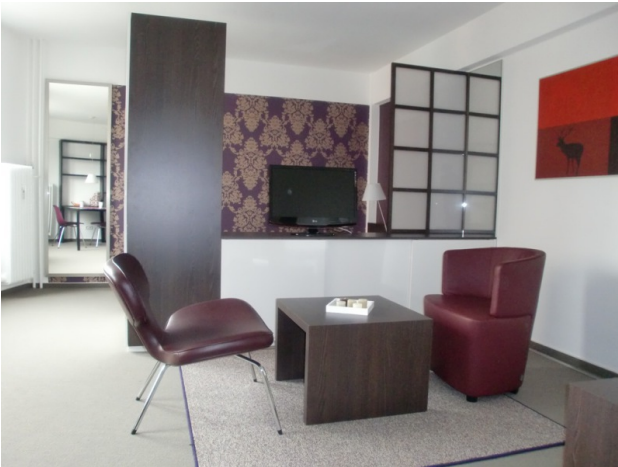
■ Wohnzimmer 2